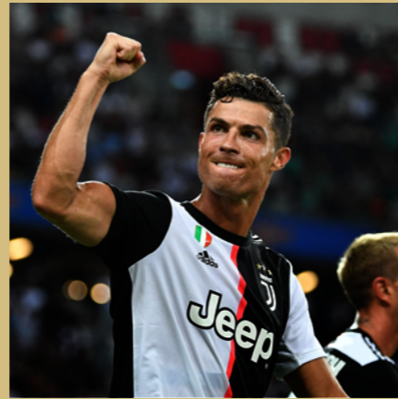
克里斯蒂亚诺·罗纳尔多 最受欢迎欧洲足球运动员