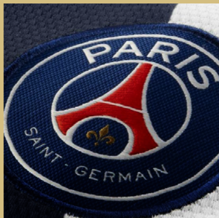
巴黎圣日耳曼足球俱乐部 最佳科技应用奖