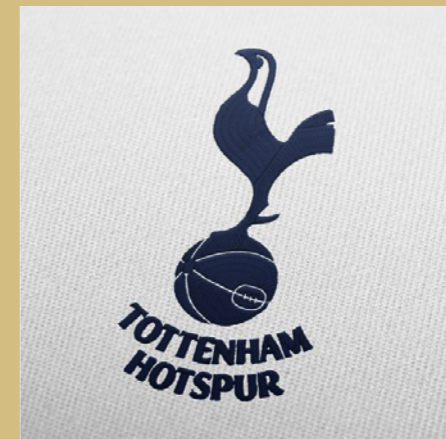
托特纳姆热刺足球俱乐部 最佳中国行策划