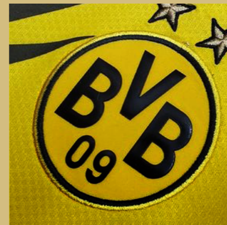
多特蒙德足球俱乐部 最佳球迷俱乐部奖