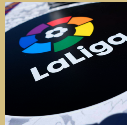
西班牙甲级联赛 最佳草根足球活动奖