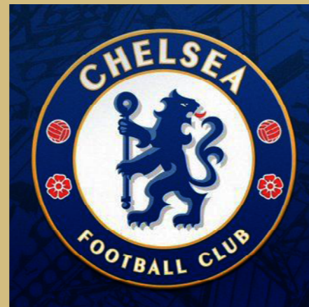
切尔西足球俱乐部 最佳微博成就