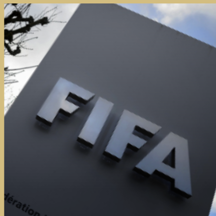
国际足联 最佳视觉设计奖