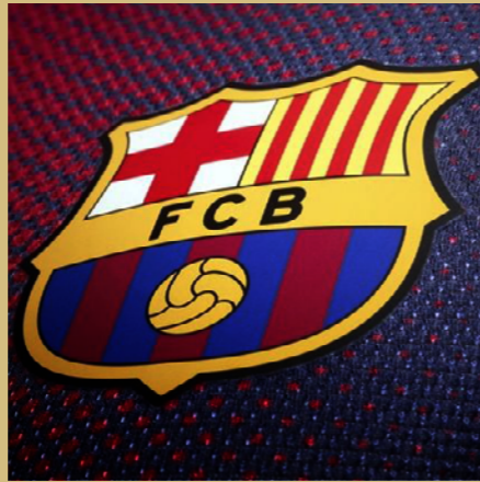
巴塞罗那足球俱乐部 最受欢迎欧洲足球俱乐部