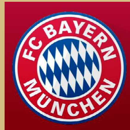
拜仁慕尼黑足球俱乐部 最佳球迷活动