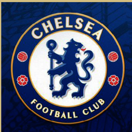
切尔西足球俱乐部 最佳原创视频奖